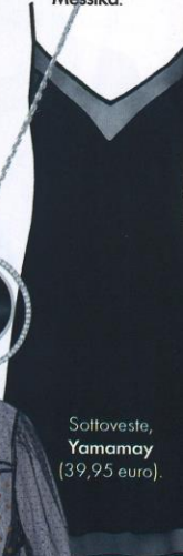
Sottoveste, Yamamay (39,95 euro).