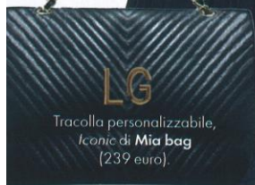
Tracolla personalizzabile, Iconic di Mia bag (239 euro).