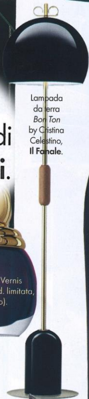
Lampada da terra Bor Ton by Cristina Celestino, Il Fanale.