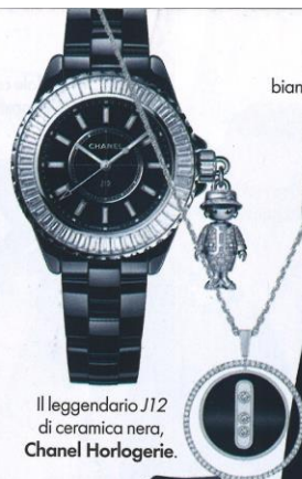
Il leggendario J12 di ceramica nera, Chanel Horlogerie.