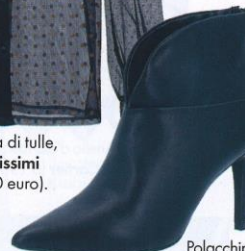
Polacchir Kharisma Qvc (71,50 eur)

BLACK messo di fare e con la sua stera nasconde a intenditrici. so garantito