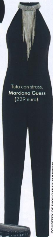
Tuta con strass, Marciano Guess (229 euro).