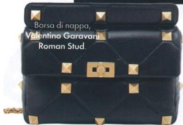
Borsa di nappa, Valentino Garavani Roman Stud.