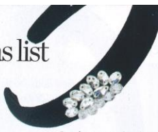
Cerchietto per bimba, iDO (9,99 euro).