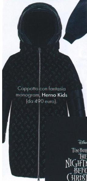
Cappotto con fantasia monogram, Herno Kids (da 490 euro).

BLACK messo di fare e con la sua stera nasconde a intenditrici. so garantito