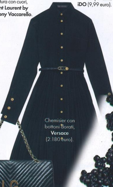
Chemisier con bottoni dorati, Versace (2.180 euro).