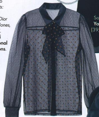
Camicia di tulle, Intimissimi (49,90 euro).