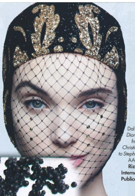
Dal libro Dior hats: from Christian Dior to Stephen Jones, AA.VV. Rizzoli International Publications.